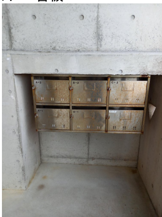
5.集合ポスト・看板